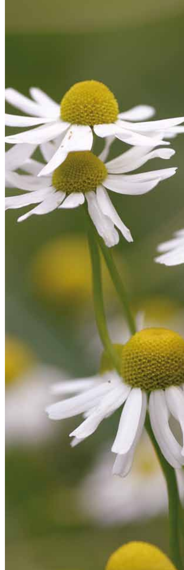
Extrakte aus der Kamille ( Chamomilla recutita ) wirken krampflösend und entzündungshemmend. Besonders wohltuend ist eine Auflage oder ein Lämpchen mit Kamillenöl auf dem empfindlichen Bauch.

Auf diese Weise lässt sich die Darmfunktion langfristig stabilisieren und das Reizdarmsyndrom somit heilen oder zumindest stark abmildern.