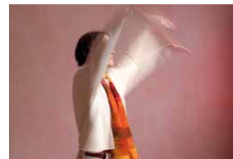
Das L ist eine fließende Bewegung, bei der die Arme in großem Kreis von unten nach oben und wieder zurück geführt werden. Es ist vor allem bei Verstopfung und bei Morbus Crohn sinnvoll.