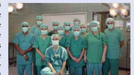
Schauen Sie doch mal nach, wer sich hinter diesen Mundschutz-Masken verbirgt – am besten direkt auf der neuen Homepage des Gemeinschaftskrankenhauses Havelhöhe unter www.havelhoehe.de .

In den nächsten Monaten wird die Homepage des Gemeinschaftskrankenhauses Havelhöhe schrittweise überarbeitet. Erste Ergebnisse sind bereits zu sehen unter www.havelhoehe.de . Sagen Sie uns Ihre Meinung über diese Neugestaltung. Wir freuen uns über jede Zuschrift (email info@havelhoehe.de )!