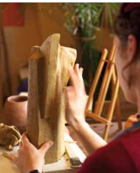
Plastisches Gestalten wie hier mit Holz gehört zu den Kunsttherapien und sind unverzichtbarer Bestandteil Anthroposophischer Medizin.