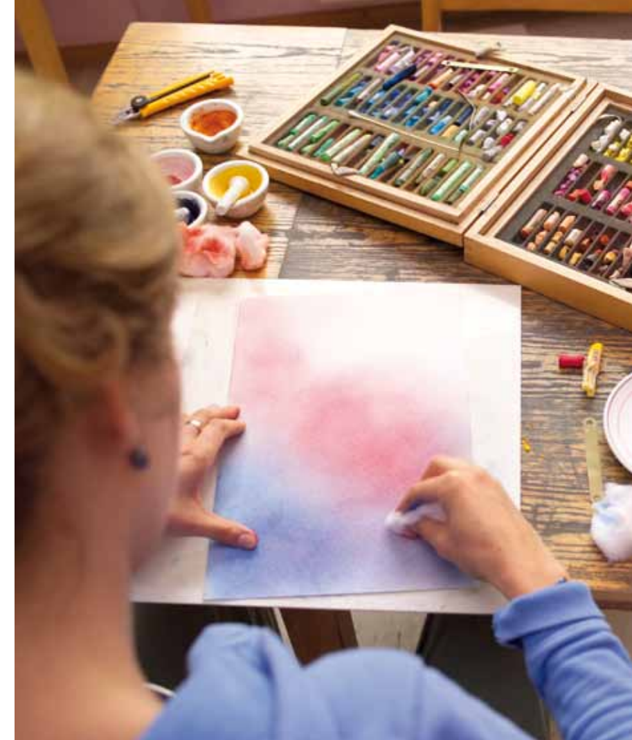
Eine Maltherapie mit Aquarellfarben oder Pastellkreiden wirkt bei chronisch-entzündlichen Darmerkrankungen heilsam und hilft bei der Auseinandersetzung mit der eigenen Biographie

Für diese Auseinandersetzung sind die künstlerischen Therapien – Malen, Plastizieren, Musik – besonders hilfreich,