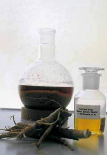
Extrakte aus der Wurzel des Gelben Enzians ( Gentiana lutea ) wirken appetitanregend und verdauungsfördernd.