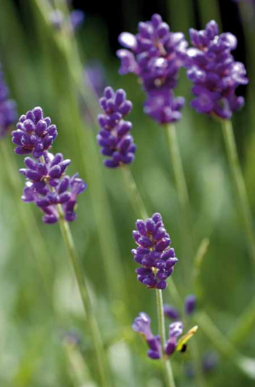
Das ätherische Öl aus Lavendel wird bei Darmerkrankungen vor allem für Auflagen, Wickel und Einreibungen verwendet. Es wirkt beruhigend und entspannend.