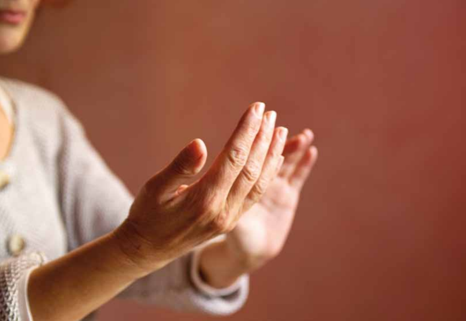
Das M ist beim Reizdarmsyndrom, aber auch bei anderen Darmerkrankungen, in der Heileurythmie eine wichtige Übung. Die Hände werden dabei mit fließenden Bewegungen vor dem Oberkörper vor- und zurückgeführt.