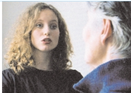
Vorbild und Nachahmung: Die Therapeutin spricht vor, die Patientin versucht, die Worte oder Laute in ihrer Aussprache möglichst originalgetreu nachzusprechen.

Die therapeutische Sprachgestaltung ermöglicht also nicht nur die Behandlung von Sprach- und Sprechstörungen, sondern ebenso den gezielten Umgang mit unterschiedlichsten Krankheiten im internistisch-allgemeinärztlichen sowie im psychosomatischen, psychiatrischen und heilpädagogischen Bereich, da sie grundlegend in das Verhältnis von Körper, Seele und Geist eingreift.