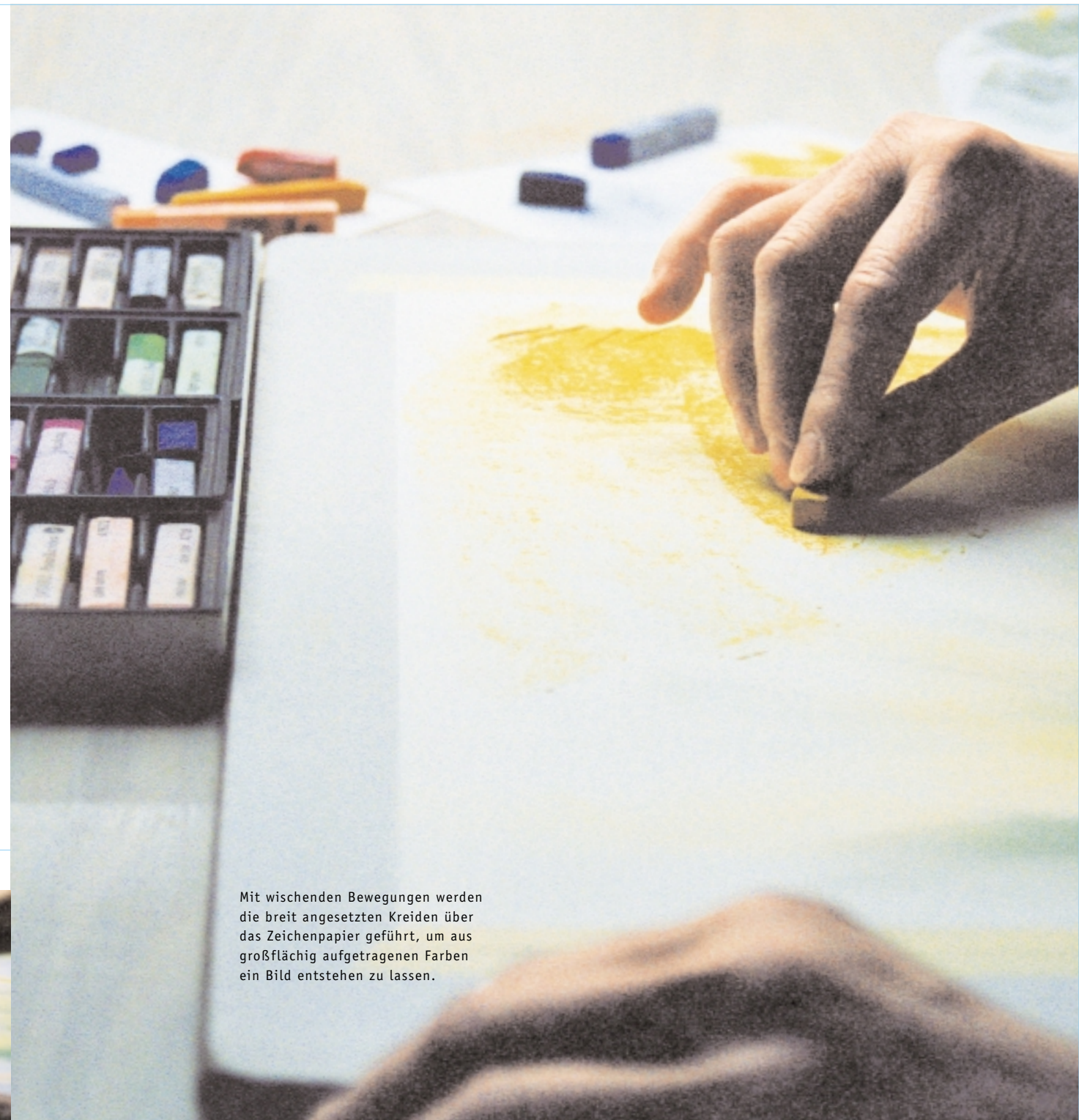
Mit wischenden Bewegungen werden die breit angesetzten Kreiden über das Zeichenpapier geführt, um aus großflächig aufgetragenen Farben ein Bild entstehen zu lassen.