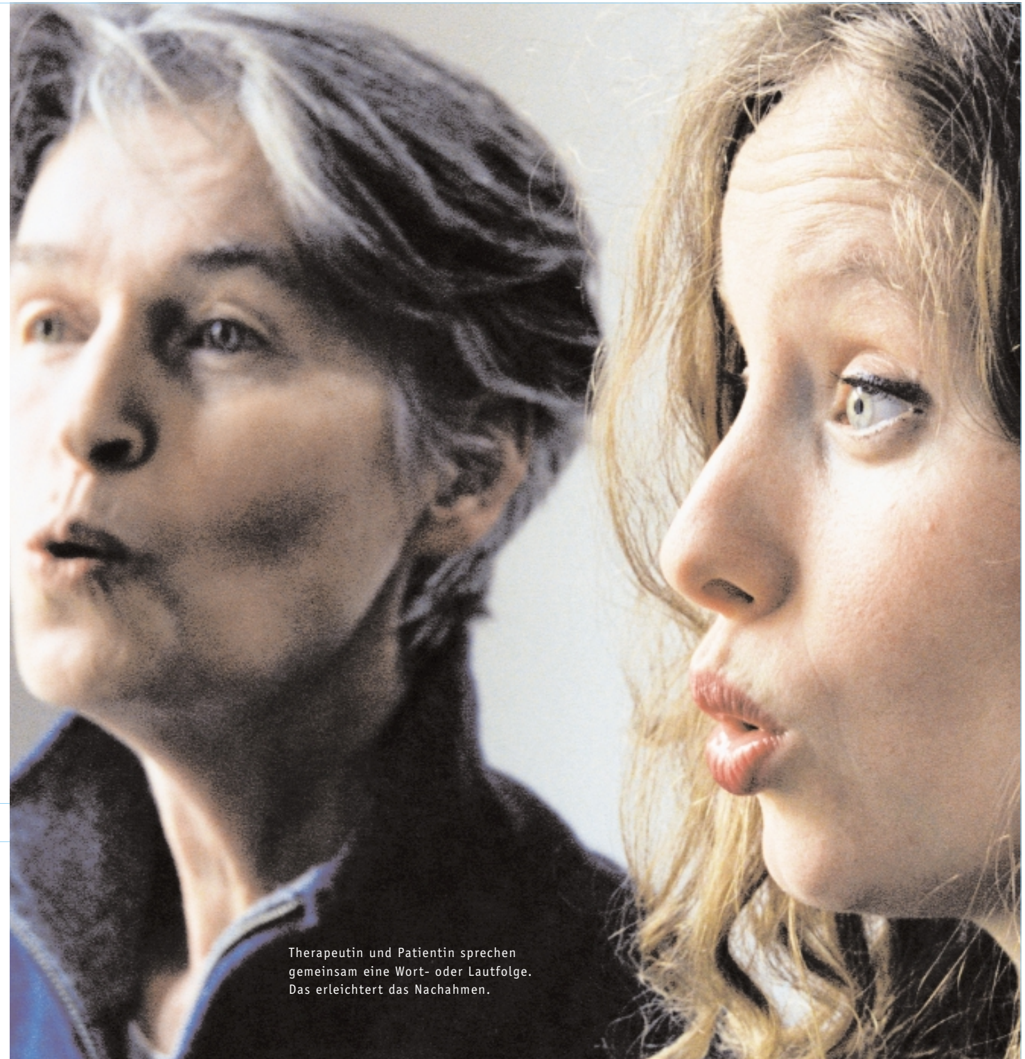
Therapeutin und Patientin sprechen gemeinsam eine Wort- oder Lautfolge. Das erleichtert das Nachahmen.