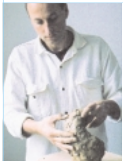
Beim plastischen Gestalten (links) ist der Patient selbst aktiv handelnd beteiligt. Mit Wickeln und Auflagen dagegen (rechts) wird er behandelt.

Mit dieser Synthese aus Natur- und Geisteswissenschaft verbindet anthroposophische Medizin den pathogenetischen – an der Krankheit orientierten – Ansatz der Medizin mit der salutogenetischen – an der Gesundheit orientierten – Sicht. Daraus resultiert ein ganzheitliches Gesundheits-, Krankheits- und Therapieverständnis – und genau das ist das Bedürfnis der Menschen in unserer Zeit.