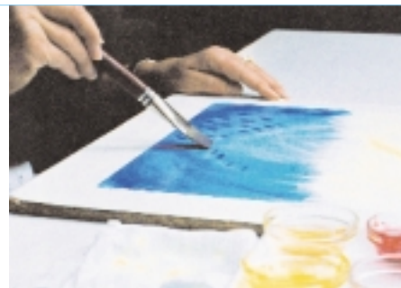
Die Auswahl der Farben und der Maltechnik – trocken mit Kreide (rechts) oder Nass-in-Nass mit Aquarellfarben (links) – richtet sich nach dem therapeutischen Ziel.