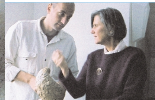
Aus der Kenntnis des therapeutischen Ziels regt die Therapeutin im Dialog mit dem Patienten die nächsten Arbeitsschritte an: Soll eine Hohlform entstehen oder eine freie Plastik? Sollen runde oder kantige Formen überwiegen?

Beim Plastizieren geht es nicht darum, ob das Ergebnis hübsch und dekorativ ist, sondern das Formen des Materials und das Ringen mit der Form lässt im Patienten neue Bilder und Kräfte entstehen. Diese tragen dazu bei, die Krankheit zu akzeptieren, zu überwinden und neuen Lebensmut zu schöpfen.