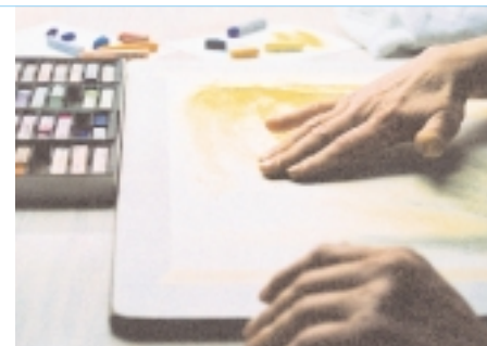
Therapeutisches Malen und Zeichnen (links), Musiktherapie (rechts) sowie rhythmische Massage (ganz rechts) gehören zum weiten Spektrum anthroposophischer Behandlungsmöglichkeiten.